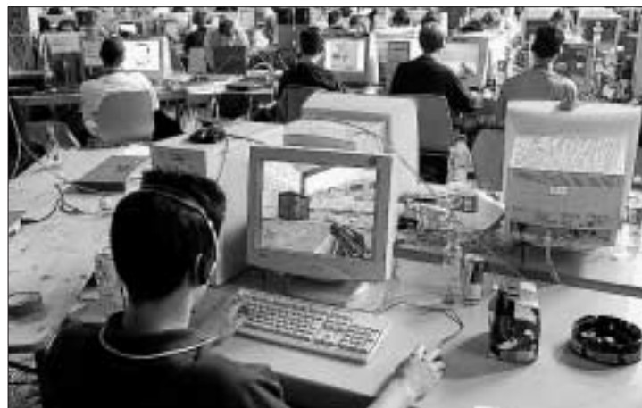
Virtuelle Kampfzone: An Netzwerkpartys wie am Wochenende in Langenthal spielen Teams Kriegssgames.

Hinweis: Bis Sonntag, 14 Uhr, Netzwerkparty Lanforce IV, Markthalle Langenthal. Infos: www.lanforce.ch.